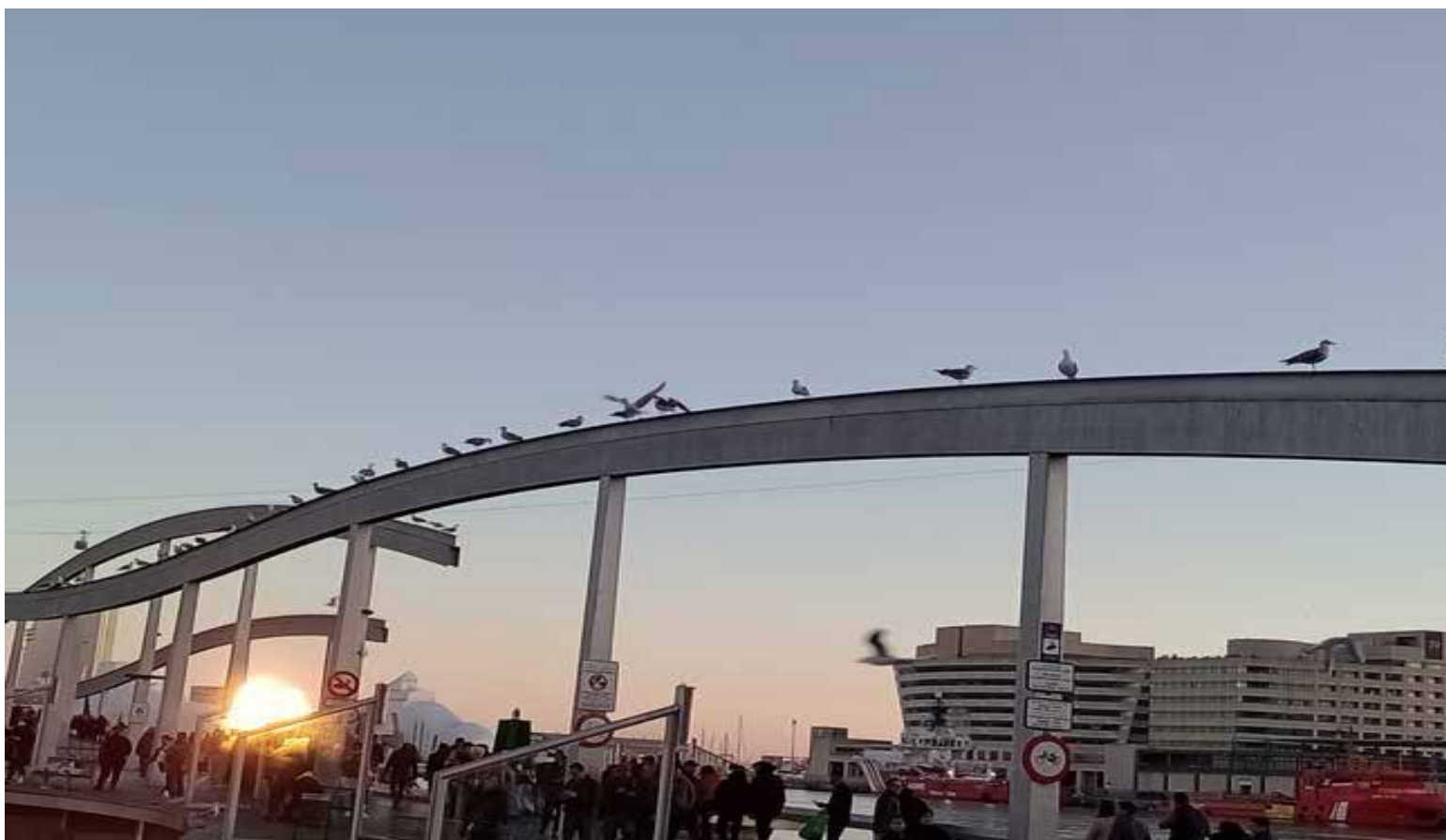
El viejo puerto bautizado el aeropuerto de las garzas.

Igualmente se disfruta de restaurantes y lugares turísticos en esta atractiva ciudad española.