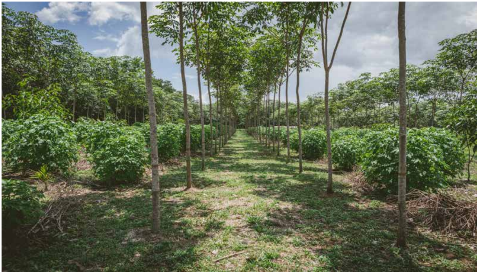
Reforestación en Colombia.

La principal bandera del Ministerio de Ambiente ha sido la lucha contra la deforestación, y eso se ha materializado con una reducción histórica del 54% de la deforestación en el país y del 61% en la Amazonía en estos dos años.