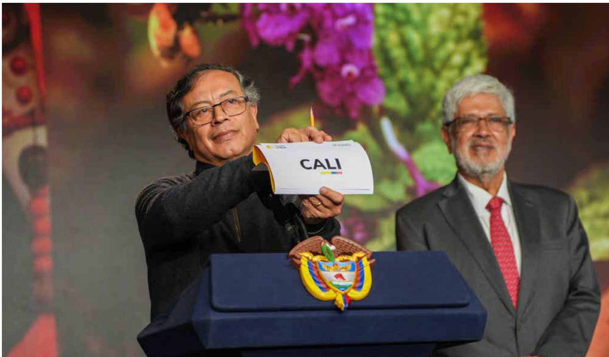
El día que el presidente Petro escogió a Cali como sede de la COP16

La COP16 es la cumbre sobre biodiversidad más importante del mundo, que se realizará este año en Cali (Colombia), del 20 de octubre al 1 de noviembre.