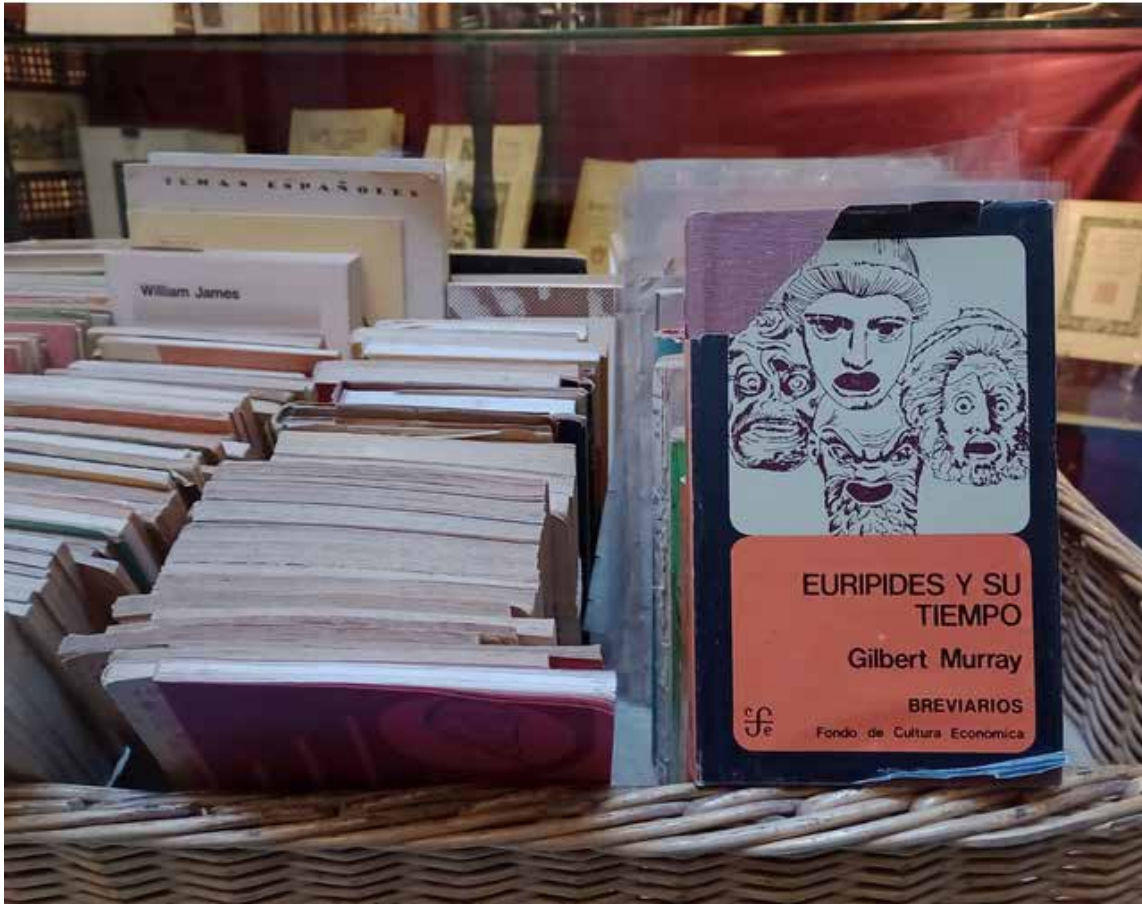
Una rústica librería del barrio Gótico.