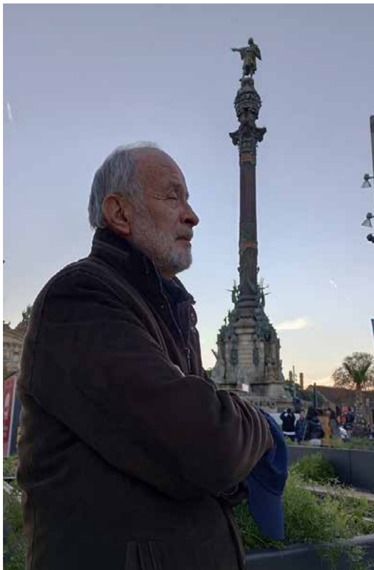
Monumento a Cristóbal Colón, en el puerto antiguo de Barcelona.