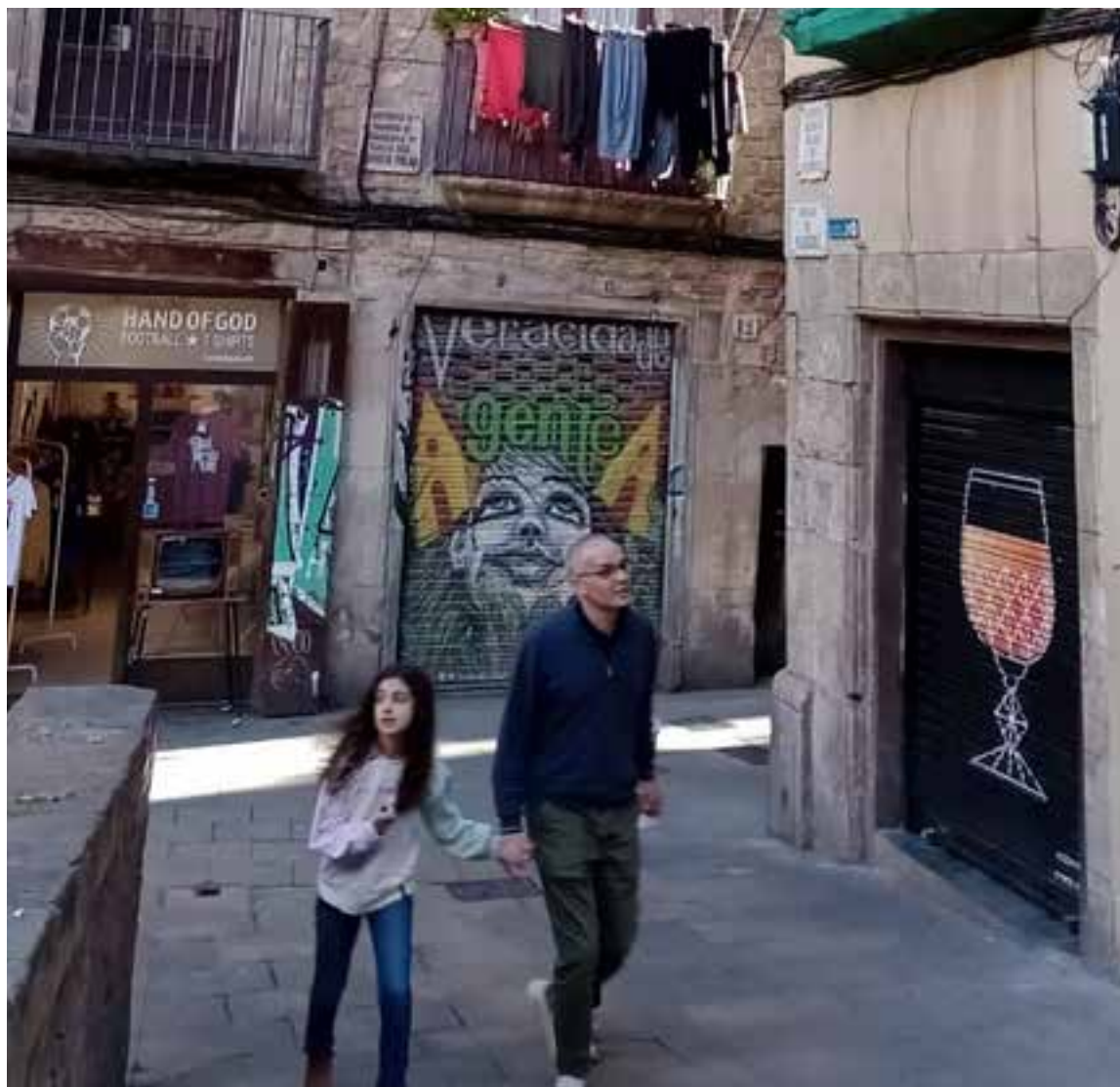
El viejo puerto bautizado el aeropuerto de las garzas.