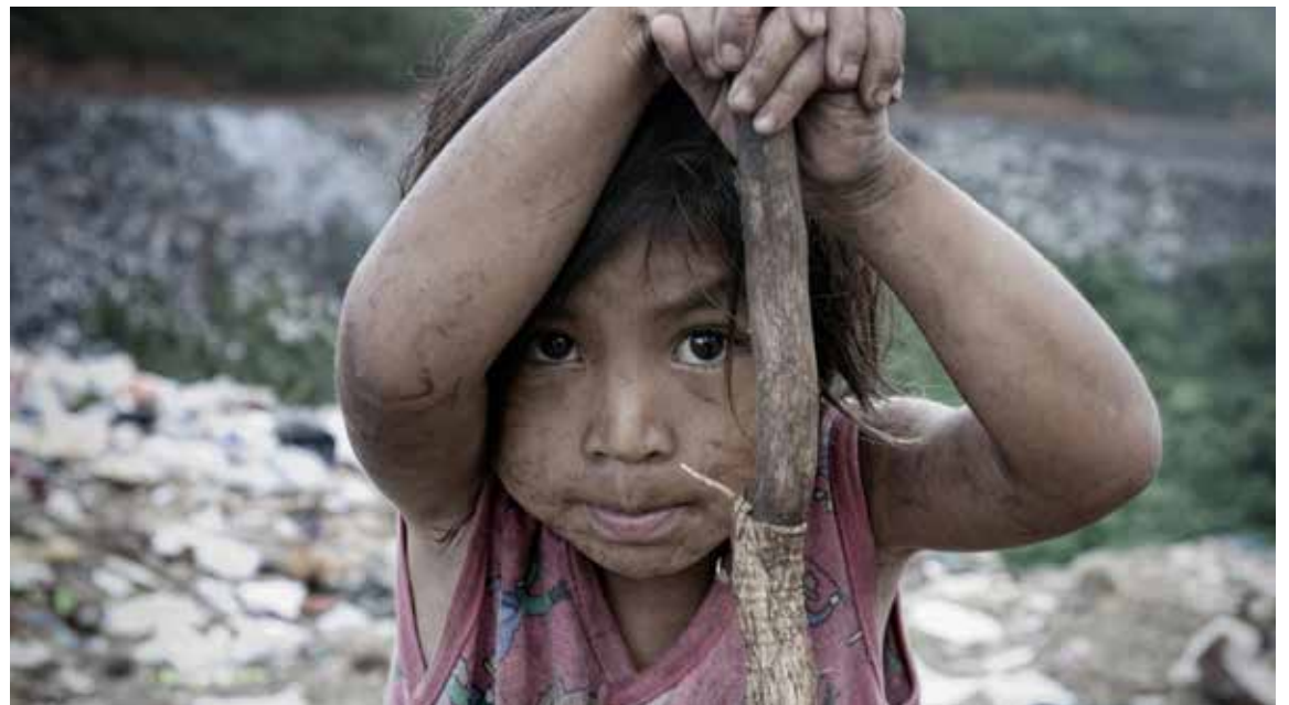
n Colombia mueren 20.000 niños de hambre y desnutrición al año. De 47 millones de habitantes, el 68% vive la angustia que da la pobreza y en el drama de la indigencia.

El campo abierto de mariposas y aire puro, lo han convertido en un infierno: ¡bombardean, fumigan,