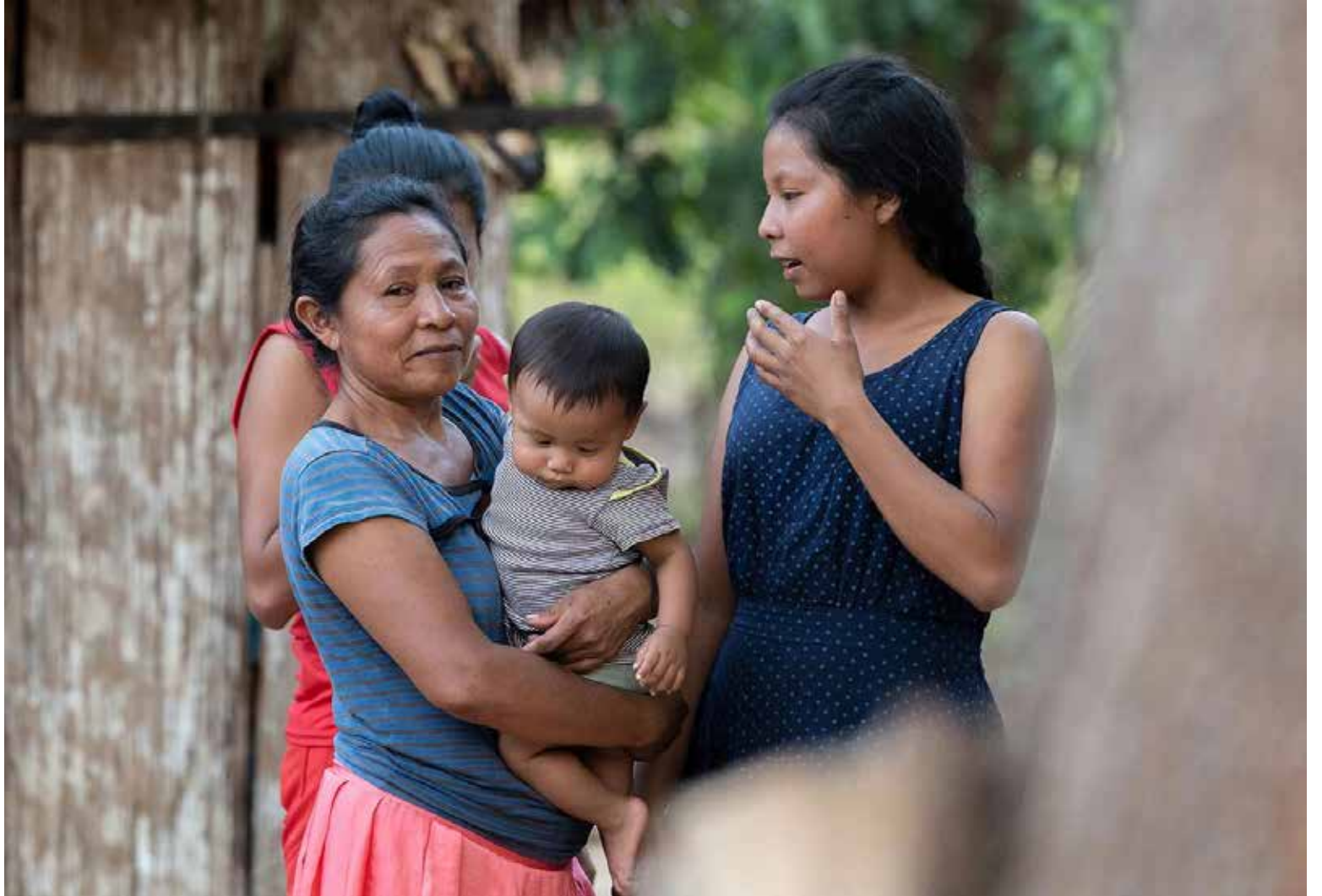
Familia indígena de Colombia

En otro país ese ruido podría ser tenido como una de las variables que intervienen para calcular las cifras adivinatorias de los economistas, pero en Colombia, donde llevamos varias décadas sosteniendo la locomotora de la economía sobre los rieles del consumo de los hogares, el que los