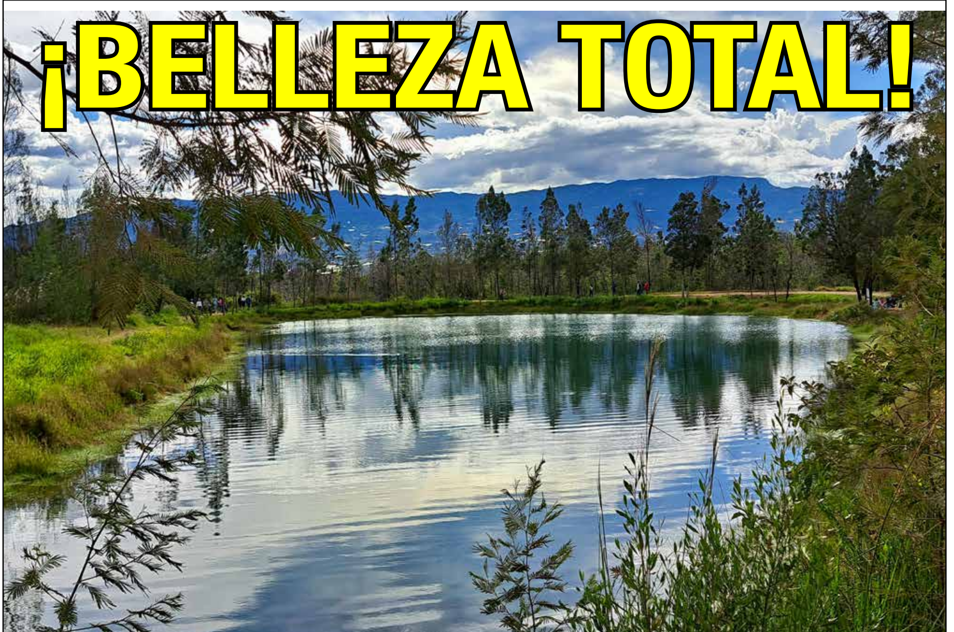
La belleza de este lugar es indescriptible, a 166 kilómetros de Bogotá, puedes deslumbrarte con estos paisajes enigmáticos.