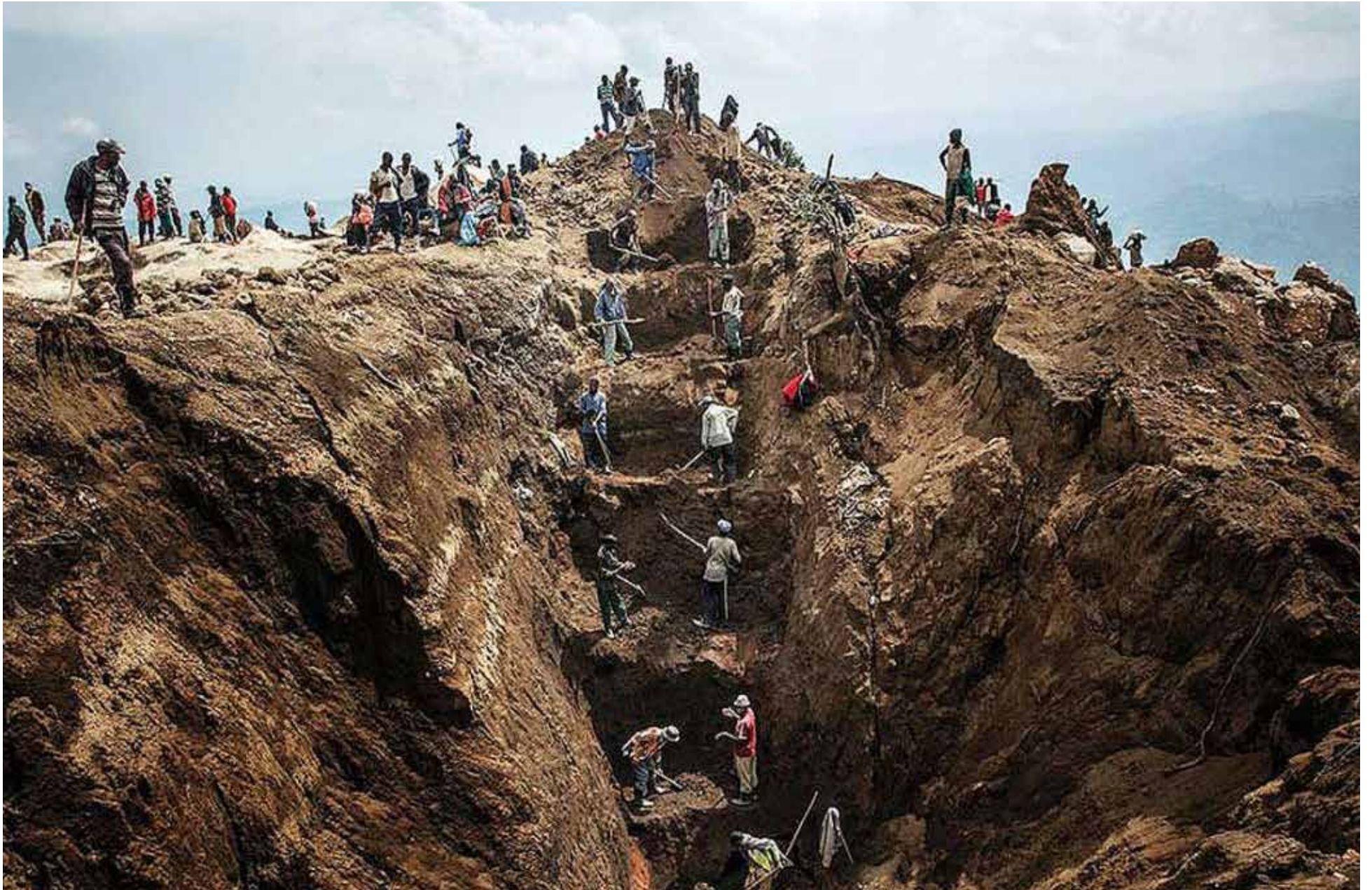
Minas de coltán a cielo abierto

E n una acción conjunta, las autoridades decomisaron 23 toneladas de coltán, en el departamento del Vichada. El mineral está avaluado en 6.600 millones de pesos. La operación fue ordenada por el