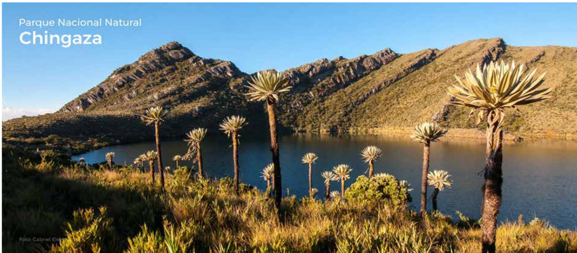
Parque Nacional Natural Chingaza