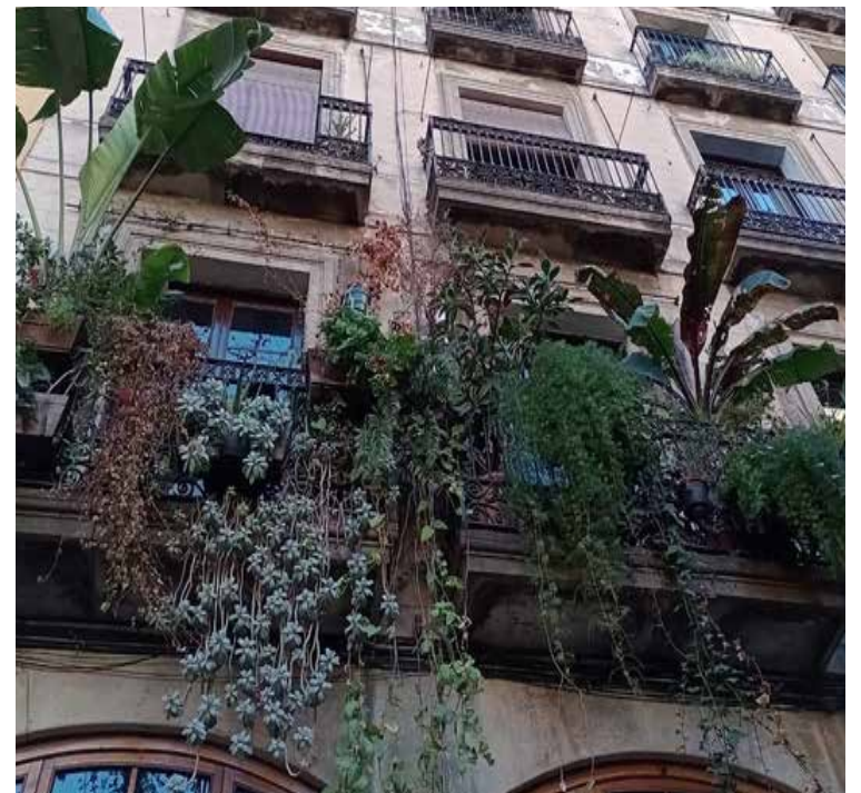
Barcelona. Barrio Gótico. Jardín de altura.